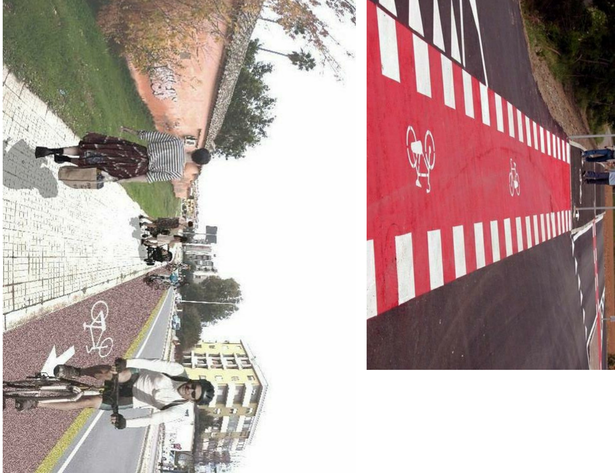
Cartelloni "turistic" per avviare a itinerario ciclopedonale su viabilità ordinaria. Esempi di segnaletica verticale progettata per guidare i ciclisti lungo i 3 itinerari principali.